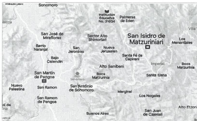
Gráfico N° 2.1.2.4. Ubicación del terreno donde se ejecutará el proyecto

"Año de la Unidad, la Paz y el Desarrollo"