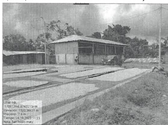
Gráfico N° 2.3.1. Campo deportivo actual en estado deteriorado y usado para secado de café.

La tecnología planteada en el proyecto de la construcción de la cancha deportiva en la localidad de San Isidro de Matzuriniari es de concreto armado (material noble), tecnología acorde a los avances de la actualidad y a la normatividad E030 y E060, para una mejor calidad de construcción y mejora de atención a los beneficiarios directos.