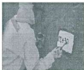
Imagen referencial N°01

Se pintará las progresivas de fondo color blanco, letras color negro, y escritura de la siguiente manera por ejemplo 02+300 .