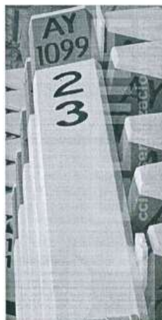
Imagen referencial N°02

Se pintará las progresivas de fondo color blanco, letras color negro, y escritura de la siguiente manera por ejemplo 02+300 .