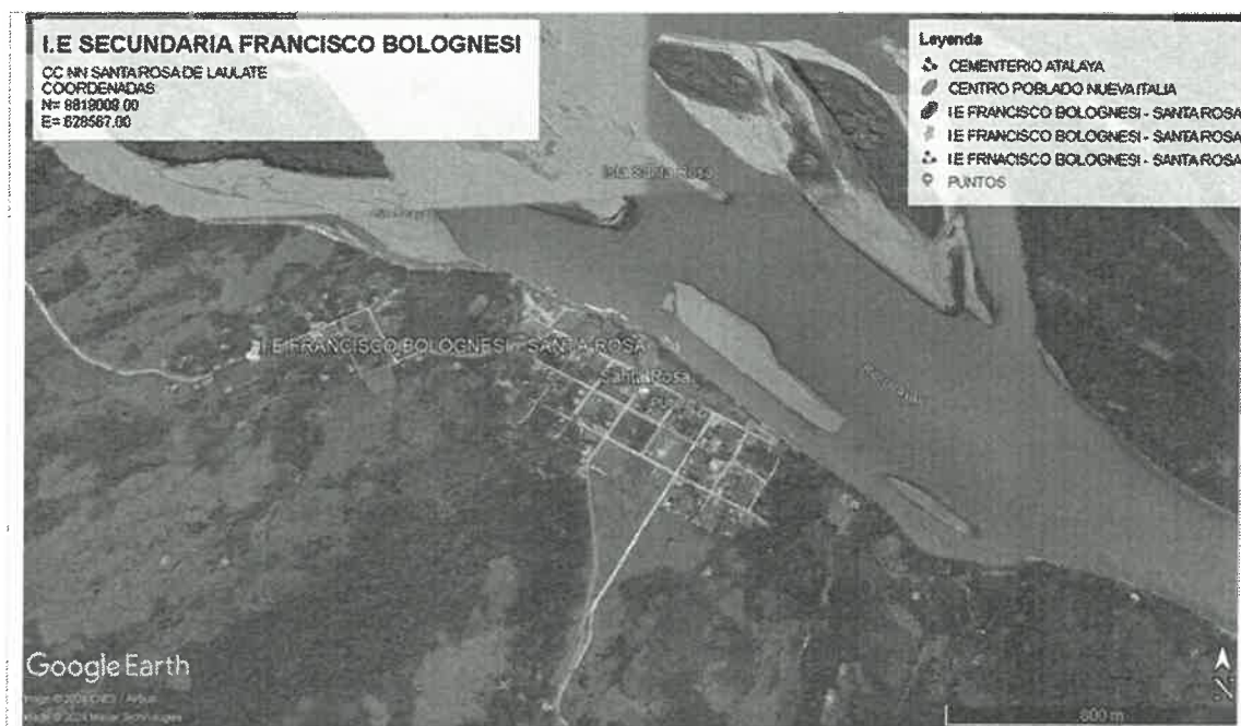
Figura 2: Vista satelital de la Comunidad Nativa Santa Rosa de Laulate.