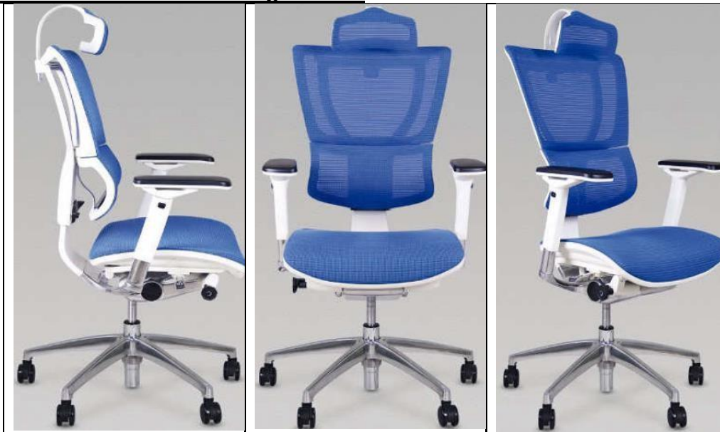
Foto Referencial de la Silla Ergonómica