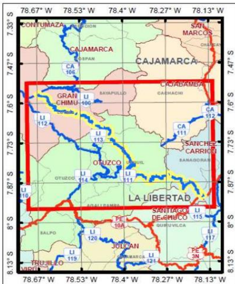
MAPA DE UBICACIÓN DE LA CARRETERA DEPARTAMENTAL LI-111

"Año del Bicentenario, de la consolidación de nuestra Independencia, y de la conmemoración de las heroicas batallas de Junín y Ayacucho"