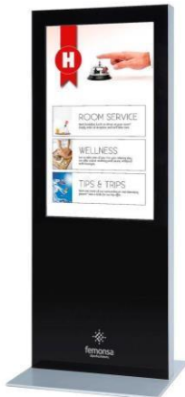
*Imagen referencial de totem digital