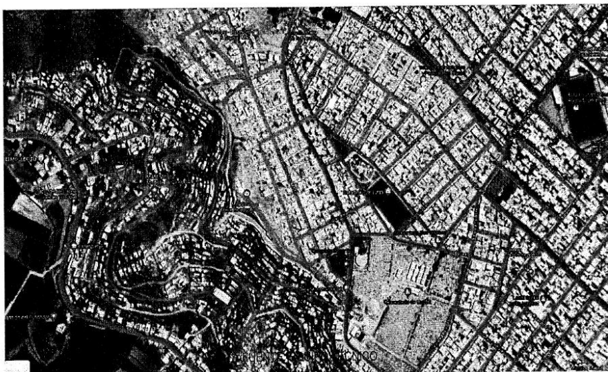
Ilustración 2: Ubicación geográfica de la Asociación de Vivienda Buen Panorama

Se puede llegar a la zona del Proyecto a través de la Avenida Juan Velazco Alvarado, Avenida Vinalea Reynoso y/o Prolongación Jirón Francisco Bolognesi.