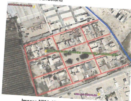
Imagen N°01: Ubicación del Proyecto