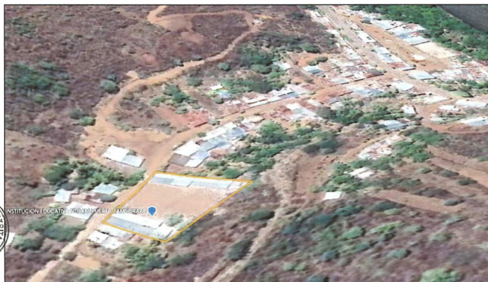
IMAGEN SATELITAL UBICACIÓN DEL PROYECTO