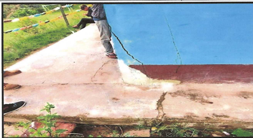
Foto: 02 Vista de pared exterior fallada.

"Año de la Unidad, la Paz y el Desarrollo"