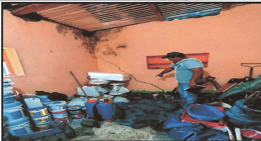
Foto: 02 Presencia de Rajaduras, en pared de adobe.

“Año de la Unidad, la Paz y el Desarrollo”