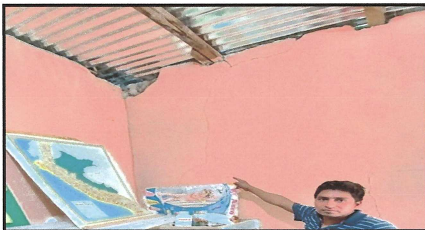
Foto: 03 Vista de Desprendimientos de parte de pared en aula.