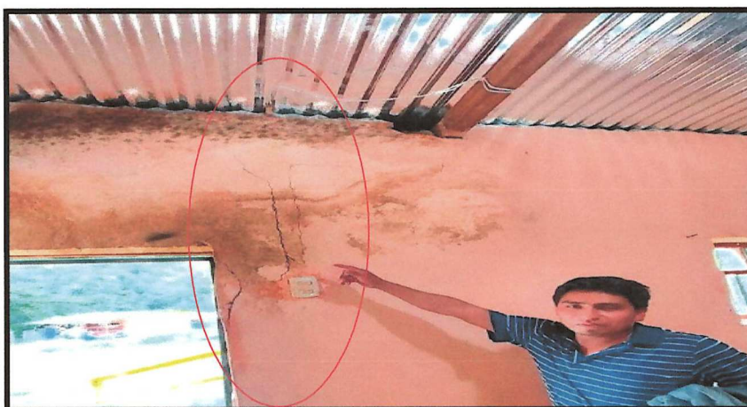
Foto: 01 Presencia de moho, goteras y grietas, en la pared.