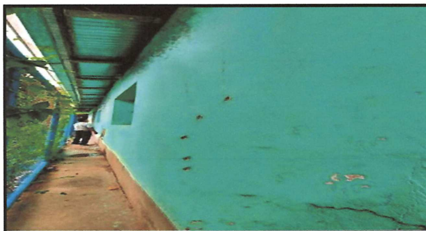
Foto: 01 Vista de paredes de Área Administrativa en condiciones de falla.