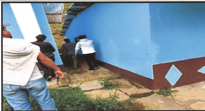
Foto: 04 Vista de veredas, pisos en mal estado.

"Año de la Unidad, la Paz y el Desarrollo"