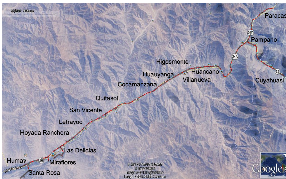
Trazo de ruta – Poligonal