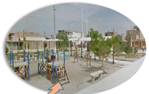
PARQUE “EL NIÑO” URB. IZABEL BARRETO