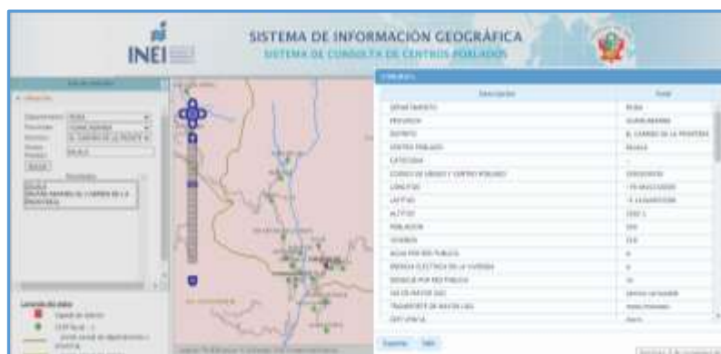
Imagen N° 01: Consulta de Ubigeo de centro poblado en data del INEI

Se deberá colocar el ubigeo de cada centro poblado del proyecto, según se muestra en la data del INEI. Para esto, se podrá acceder al sitio web: http://sige.inei.gob.pe/test/atlas/ .