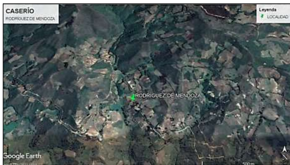
Ilustración 1.- Ubicación del caserío Rodríguez de Mendoza

Por el Norte : Distrito de Huancabamba Por el Sur : Distrito de Huarmaca. Por el Este : Distrito de Sondor. Por el Oeste : Distrito de San Miguel de El Faique, Canchaque.