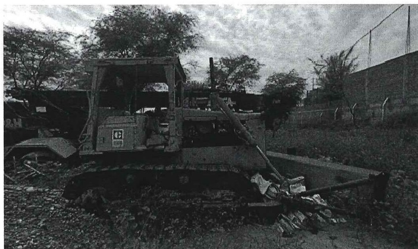
IMAGEN 01: Tractor Oruga Caterpillar, código patrimonial 673692590002.

El Proyecto Especial Chira Piura tiene como misión: Promover, desarrollar, administrar, operar y mantener la infraestructura hidráulica en las cuencas Chira y Piura que abastecen el agua para uso poblacional y productivo, del tipo agrario, acuícola, energético, industrial, minero, recreativo y turístico. Promover y propiciar el uso racional, eficiente y sostenible del agua produciendo, comprobando y transfiriendo conocimiento y tecnología para optimizar su aprovechamiento. Promover la inversión privada para el desarrollo y la administración de nueva infraestructura hidráulica y fortalecer a las organizaciones de usuarios para la gestión de los recursos hídricos, la operación y el mantenimiento de la infraestructura hidráulica a su cargo . Esta misión se ve afectada por no contar con la maquinaria y equipos que permitan el buen desarrollo de las actividades de mantenimiento, descolmatación, y limpieza de drenes, canales y caminos de servicio. Puesto que como institución encargada de esta importante misión solo cuenta con maquinaria obsoleta cuya vida útil ya se cumplió, el siguiente panel fotográfico evidencia lo mencionado: