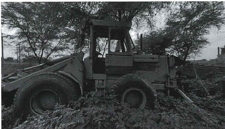
IMAGEN 05: Sistema hidráulico requiere reparación general