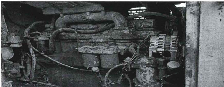
IMAGEN 07: Camión Volquete Volvo EGR-342, código patrimonial 678299500013.