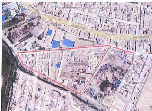
Imagen N°01: Ubicación del Proyecto