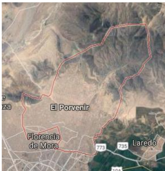
Ilustración 1 - Ubicación del proyecto en el distrito de El Porvenir- Trujillo- La Libertad

Tiene un área territorial de 36.7 km 2 . Su capital es El Porvenir. Tiene una población aproximada de 192,002 habitantes.