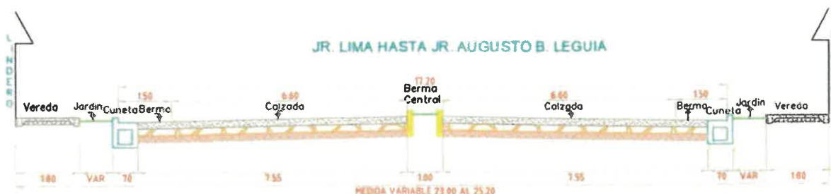
Sección típica del Jr. Mollendo (Entre Av. Jhon F. Kennedy y Jr. Augusto B. Leguía)

Con respecto a la determinación de los niveles de excavación, se ha efectuado el trazo de la sub-rasante con la finalidad de mantener en lo posible una medida cercana al nivel de trazo existente, así como proveer posibles deterioros involuntarios de viviendas, ello permitirá evitar demasiados cortes para el movimiento de tierras, así como también cuidar en el otro extremo que la vía resulte demasiado alta para su normal funcionamiento.