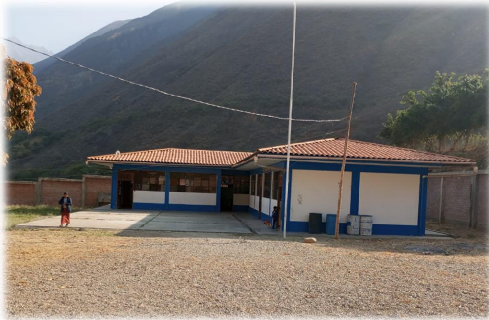
Ilustración: Institución Educativa nivel Primario Bellavista

Actualmente el área de la construcción de la I.E presenta una topografía plana y con un área aproximadamente 369.50 m 2 ; quedando más área libre para la parte del frente.