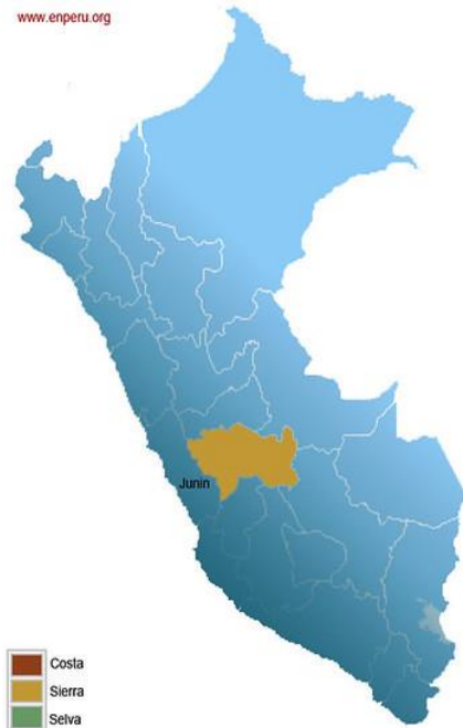
Mapa del Perú, ubicando región Junín Huancayo