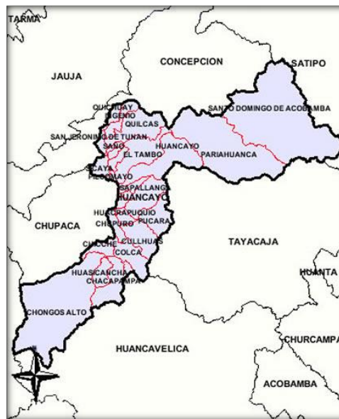
Mapa de Huancayo, ubicando Distritos de Huancayo