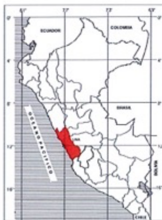
MAPA DEL PERU

Distrito : NUEVO IMPERIAL Provincia : CAÑETE Región : LIMA Lugar : DIVERSAS CALLES DEL CENTRO POBLADO SANTA MARIA