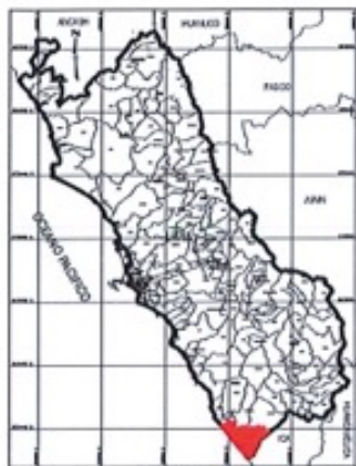
MAPA POLITICO DEPARTAMENTO LIMA

MUNICIPALIDAD DISTRITAL DE NUEVO IMPERIAL SUB GERENCIA DE OBRAS PUBLICAS Y LIQUIDACIONES