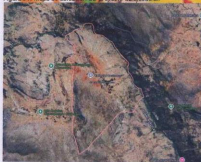
Figura 01: Mapa de ubicación del proyecto de ejecución

Localidad : I.E. N° 3013 Distrito : CARHUACALLANGA Provincia : HUANCAYO Región : JUNÍN