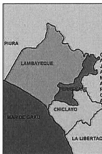
Mapa 02: Localización de la provincia de Chiclayo en Lambayeque