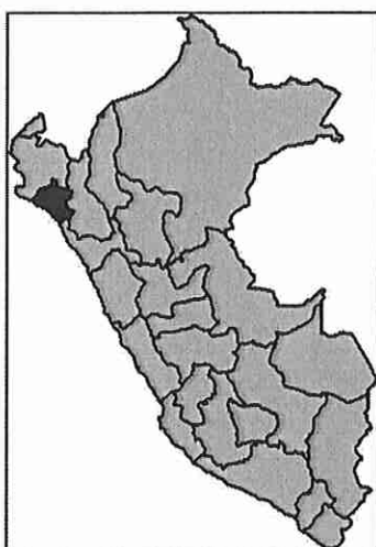
Mapa 01: Localización de la Región Lambayeque en el Perú