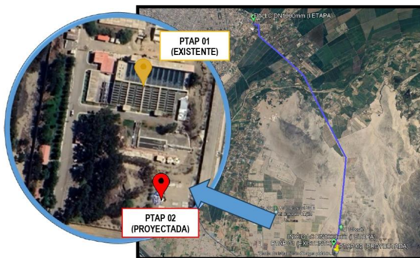
Figura 1 UBICACIÓN PTAP 02 (PROYECTADA).