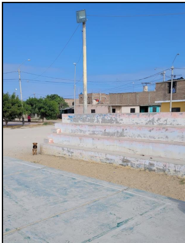
Imagen N°03: Arco y Tablero deteriorado