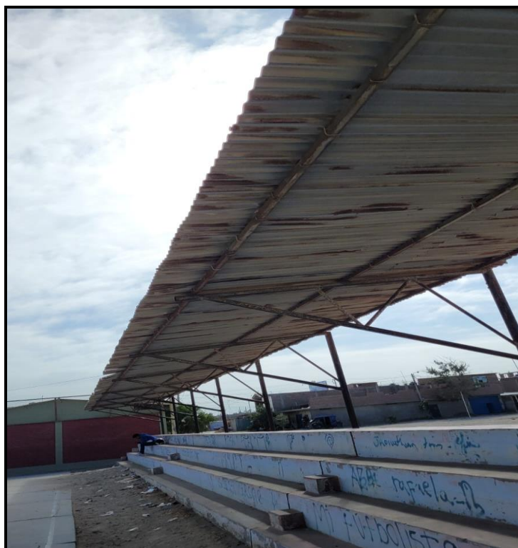
Imagen N°01: Cubierta oxidada

Después de realizar la visita de inspección correspondiente, se pudo constatar que la cubierta de las tribunas su estructura esta oxidada y la calamina deteriorada, la pintura de las tribunas y losa esta desgastada, así mismo el mobiliario de la plataforma, los arcos están oxidados y los tableros desgastados lo cual impide el óptimo desarrollo de las actividades recreativa.