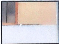
Vista de las juntas entre la tabiquería y los elementos estructurales en aulas