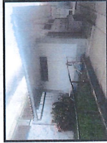
Vista de las baterías de los servicios higiénicos