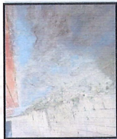
Vista del estado de los cerros perimétricos