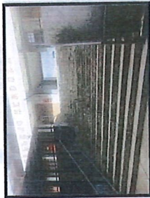
Vista del proscenio y las escaleras