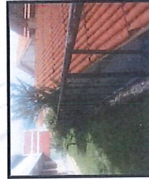
Vista de las barandas metálicas