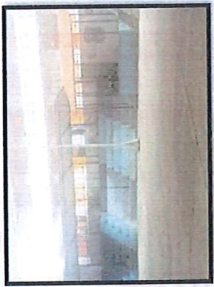
Vista de la tribuna de la Institución educativa