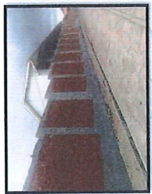
Vista del estado del cerco perimétrico y los portones de ingreso