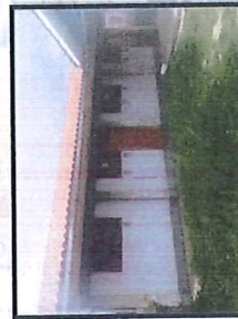
Vista del módulo del comedor