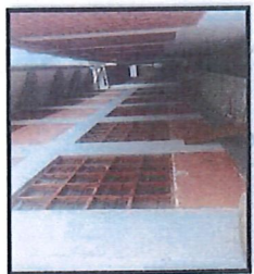
Vista del estado de las puertas y ventanas de madera en los pabellones