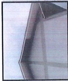
Vista del alero en mal estado y faltante en los pabellones

Balcon de los conchucos "Año de la unidad, la paz y el desarrollo"