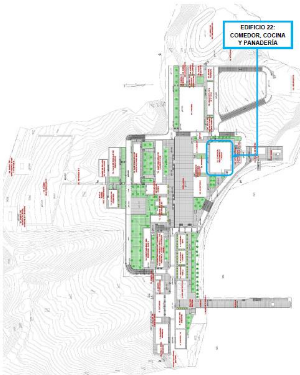
Grafico N°02. Emplazamiento del edificio dentro del CENTRO DE ENTRENAMIENTO