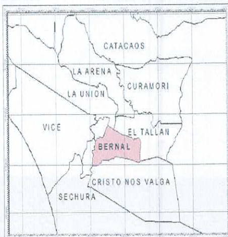
Ilustración 3: Ubicación Distrital