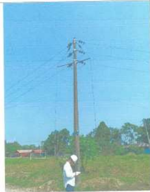
POSTE 7: Retiro de poste, desmontaje de línea.