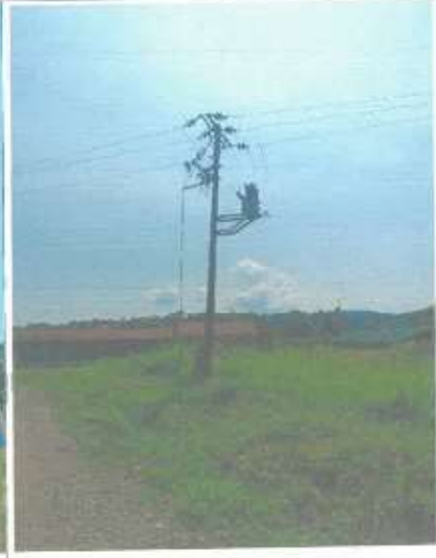
POSTE 8: Retiro de poste, desmontaje de línea, reubicación de poste a nuevo punto de diseño.