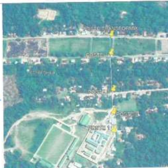
Distribución de postes en la red de utilización de media tensión.