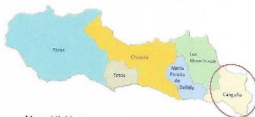
Mapa N° 03: Ubicación distrital de Los Morochucos.