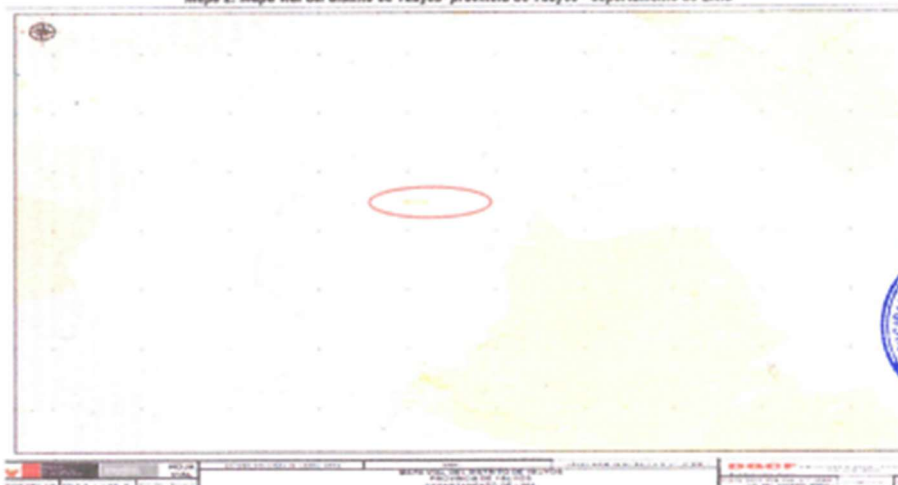
Mapa 2: Mapa vial del distrito de Yauyos- provincia de Yauyos - departamento de Lima