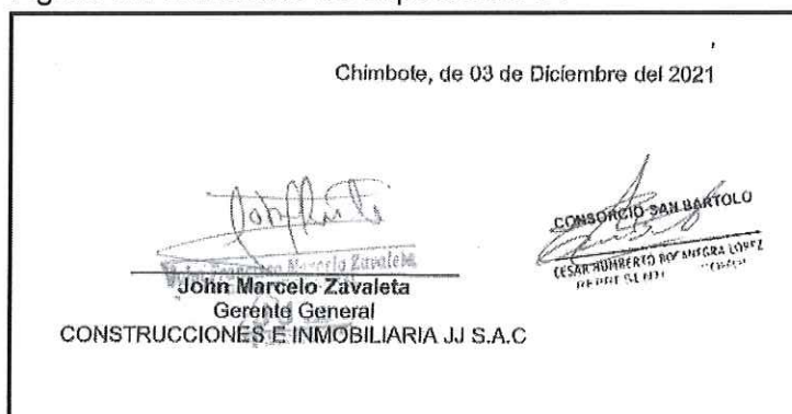
Figura 02: certificado de experiencia 04

Figura 01: certificado de experiencia 01