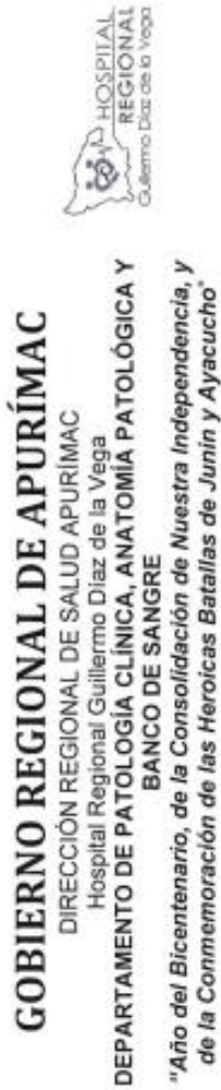
CRONOGRAMA DE ENTREGA DE REACTIVOS DE INMUNOSEROLOGÍA PARA TAMIZAJE DE UNIDADES DE SANGRE