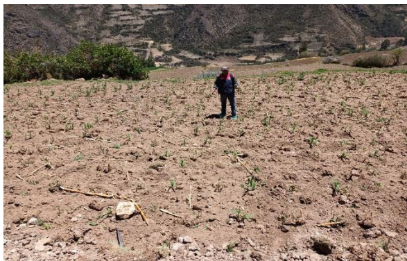
Foto: déficit de provisión de agua en el cultivo de MAIZ