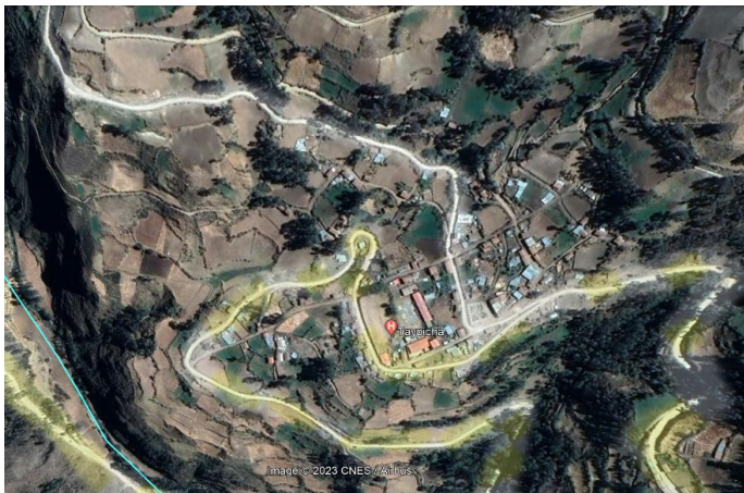
Grafico N° 03: ubicación de la población bonificaría

La localidad de Taypicha está ubicado en las coordenadas UTM 668243.92 m E- 8477860.32 m S a una altitud de 3370 msnm.