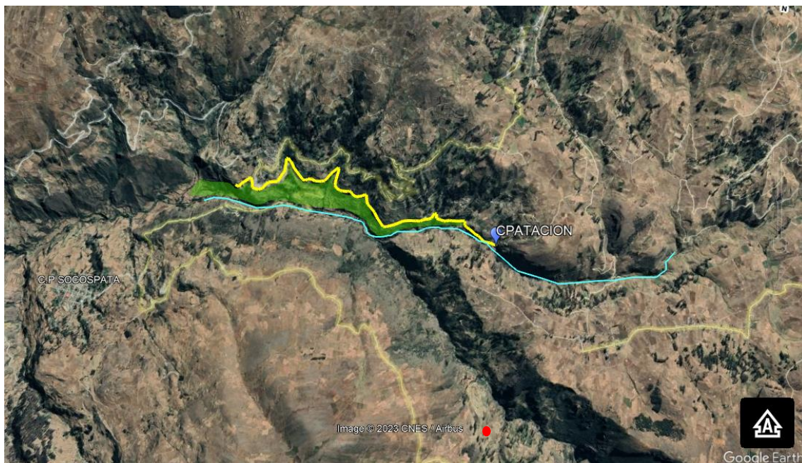
Gráfico N° 01: área de estudio y área de influencia.

Lo anterior mencionado es referencial, para el análisis del área de estudio el consultor deberá delimitar las áreas agrícolas a intervenir, utilizando adecuados equipos.