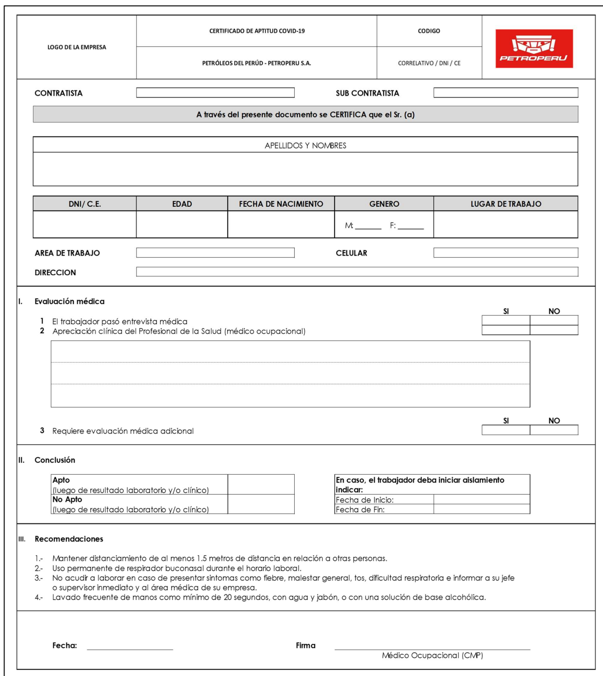
Figura N° 2. Certificado de Aptitud COVID-19 (versión impresa).