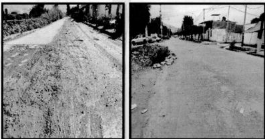
IMAGEN N°06. ESTADO ACTUAL DEL SERVICIO DE TRANSITABILIDAD VEHICULAR Y PEATONAL EN LA CALLE INDEPENDENCIA