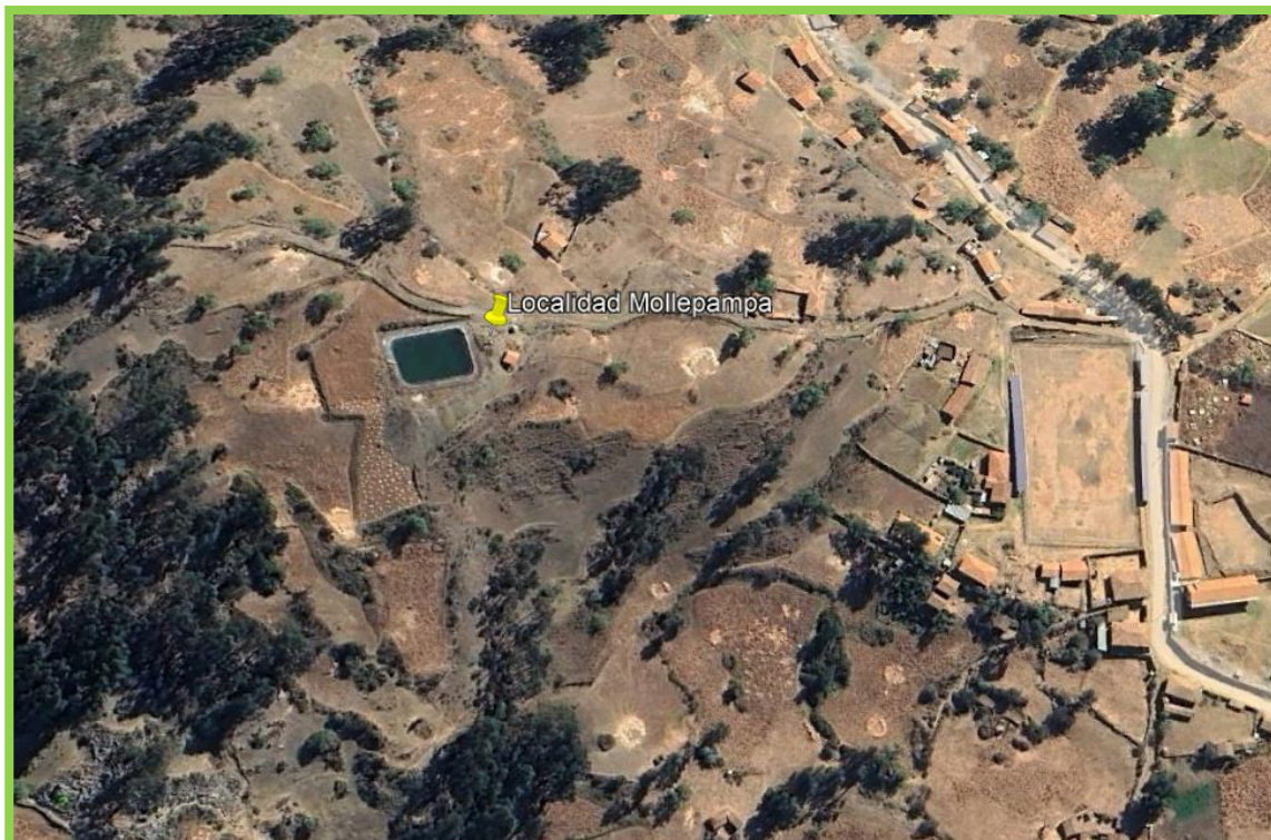
LOCALIDAD DE HUAYCHÓ - MOLLEPAMPA