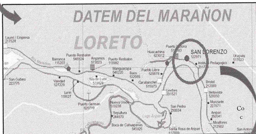
Fig. 03: LOCALIZACIÓN DE LA ZONA DEL PROYECTO