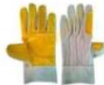
GUANTES DE CUERO

Para determinar que los postores cuentan con las capacidades necesarias para ejecutar el contrato, el órgano encargado de las contrataciones o el comité de selección, según corresponda, incorpora los requisitos de calificación previstos por el área usuaria en el requerimiento, no pudiendo incluirse requisitos adicionales, ni distintos a los siguientes: