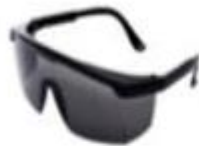
LENTES DE SEGURIDAD